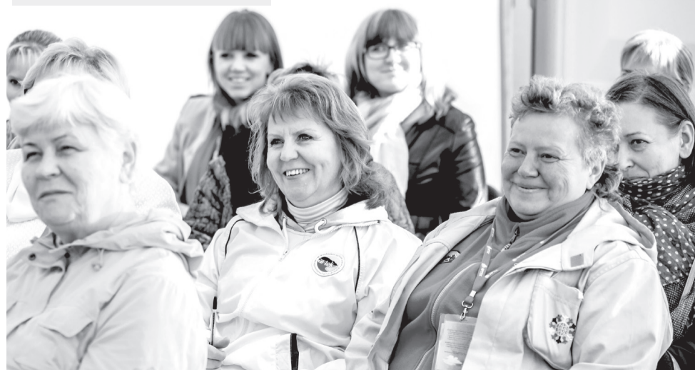
Артековцы на мастер-классе

– Спасибо «Артеку» за то, что, все «умы России» объединил на своей территории. Я бывала на различных мастер-классах, круглых столах и увидела, что образование у нас находится в надежных руках. Я хотела бы, чтобы мой ребенок участвовал в таких программах, где даже химия и физика становятся предметами, которые можно изучать с удовольствием.