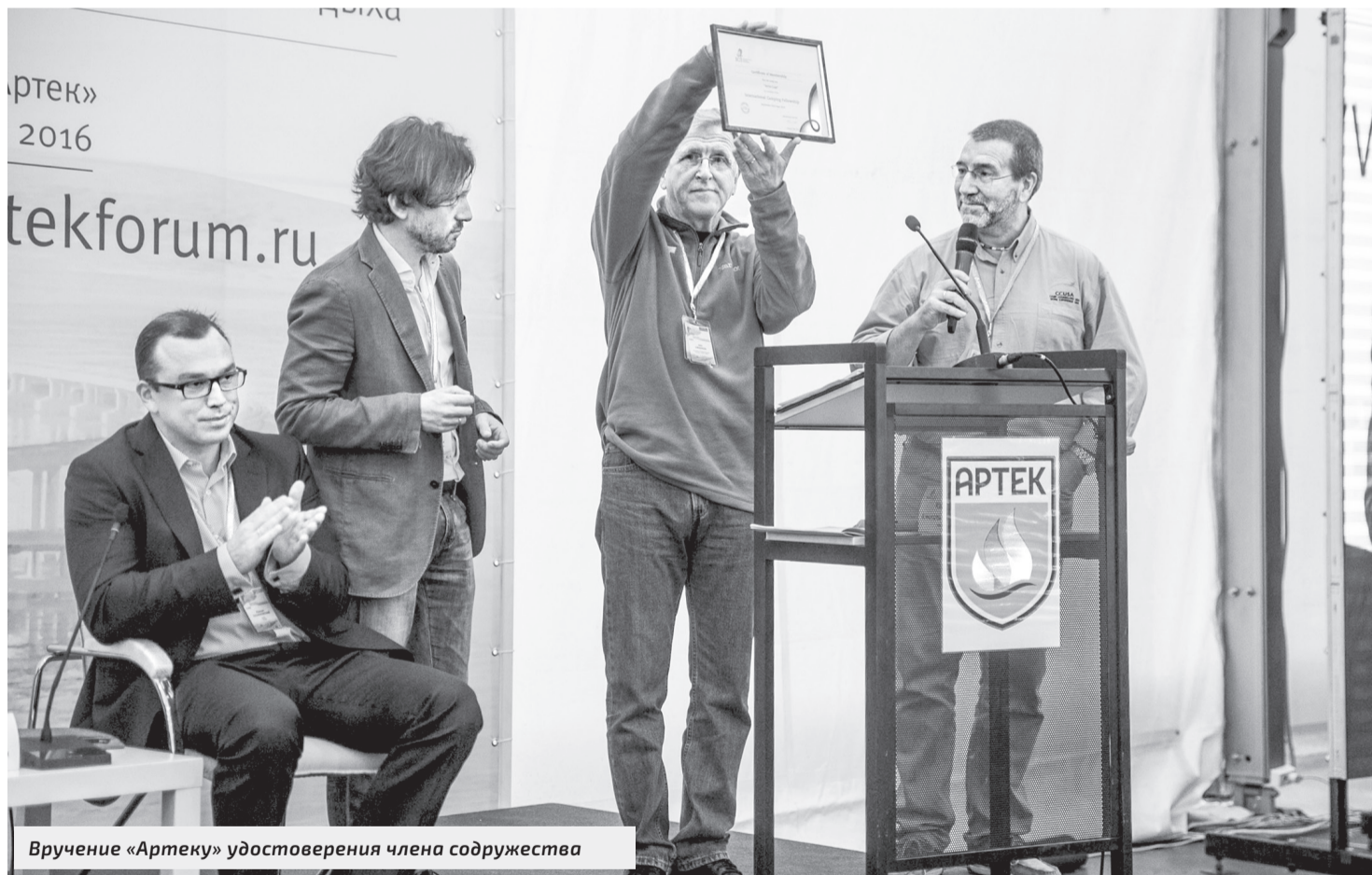
Вручение «Артеку» удостоверения члена содружества