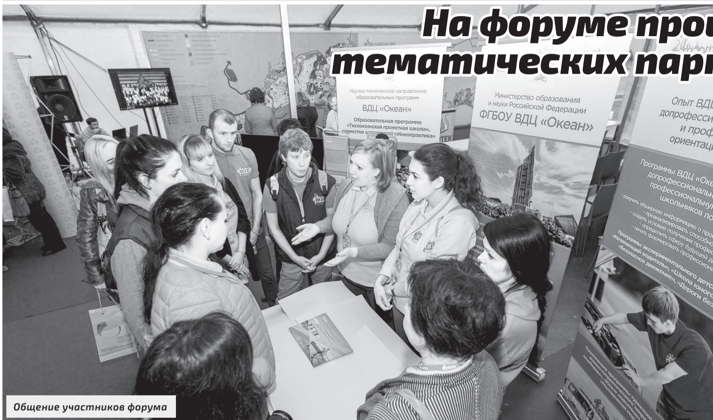
Общение участников форума

Заявки на участие в конкурсе принимались с января по октябрь этого года. А 12-14 октября прошел второй, очный этап конкурса тематических программ, которые будут реализовываться в «Артеке» в следующем году. Оценивала проекты конкурсная комиссия в составе специалистов профильных подразделений «Артека» – управления организационно-методической работы, управления по туризму, физкультуре и спорту, а также преподавателей школы.