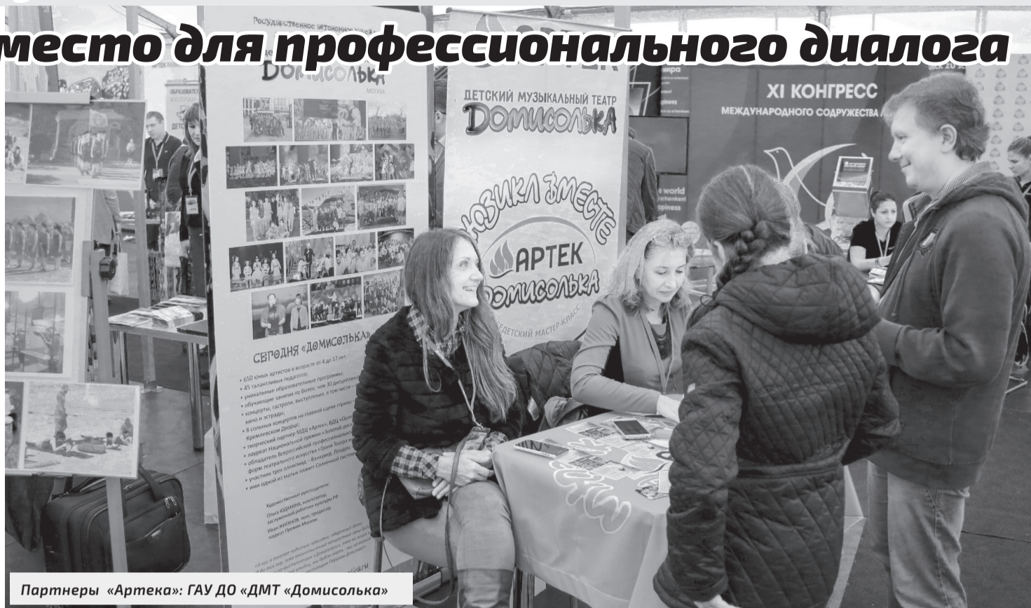
Партнеры «Артека»: ГАУ ДО «ДМТ «Домисолька»

– На примере партнерства с «Артеком» я могу говорить о том, что образовательные лагеря эффективно решают вопрос профориентации детей на высокотехнологичные отрасли экономики. Почта России сейчас находится на пути преобразований, она становится высокотехнологичным предприятием, но никакие технологические улучшения невозможны без кадровой модернизации. Новая реальность диктует необходимость привлечения молодых профессиональных сотрудников, которые способны быстро учиться, осваивать инновационные услуги. Ранняя профориентация, возможная в условиях лагеря, игровые формы, привлекательные для детей, заинтересованность