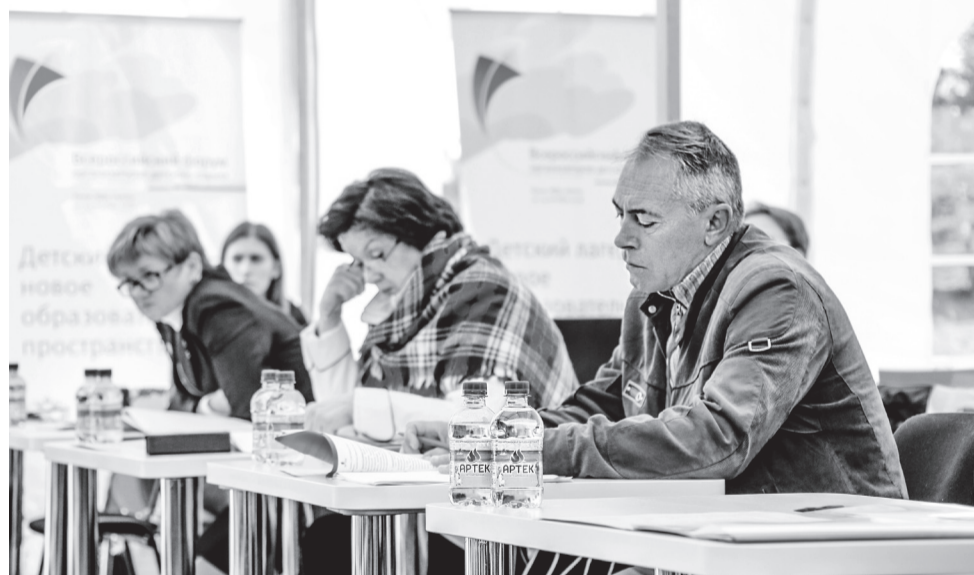
Члены жюри конкурса