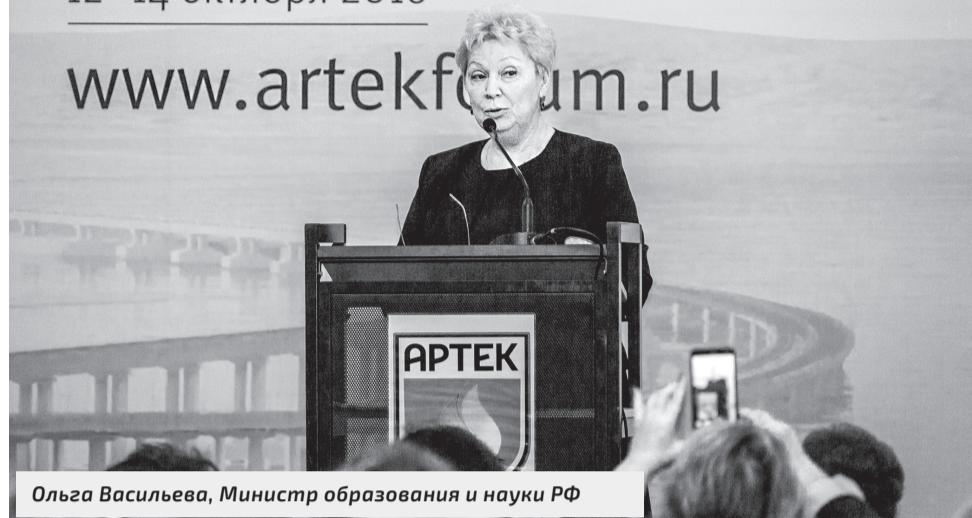
Ольга Васильева, Министр образования и науки РФ

ных требований к деятельности лагерей и лицензированию, заметив, что все коллеги понимают необходимость этого шага. Вместе с тем, общее пожелание состоит в том, чтобы «закон сопровождался проектами подзаконных актов и порядками, которые можно было бы обсуждать в комплексе, чтобы была внесена дорожная карта».