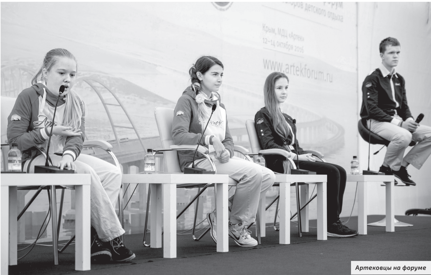
Артековцы на форуме

В заключительный день форума со взрослыми своим пониманием того, что такое образовательный лагерь, поделились артековцы.